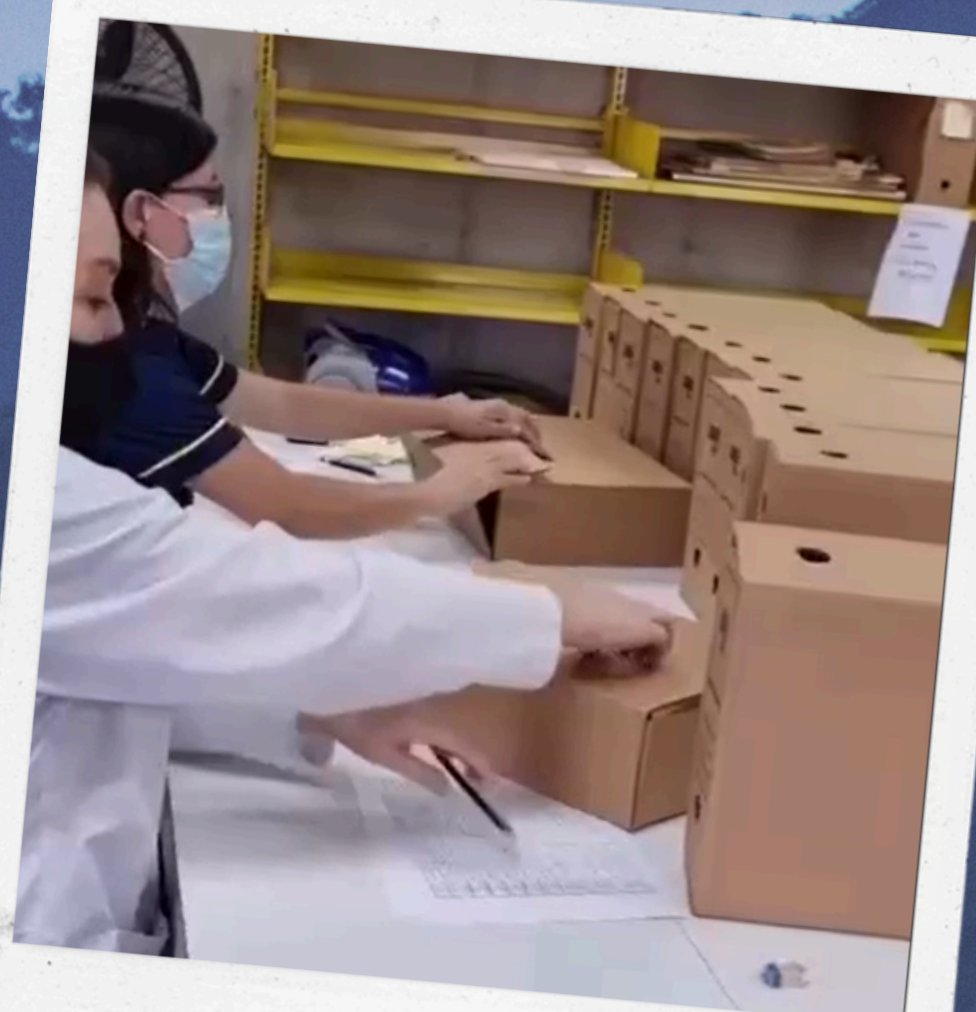
TRANSFERENCIAS DOCUMENTALES DE CONAVI