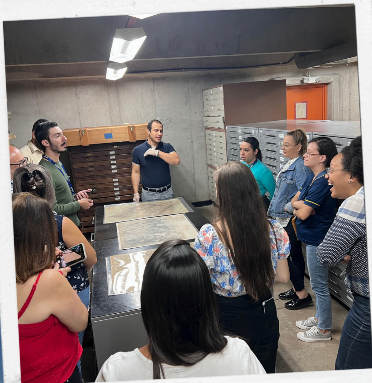
DEPÓSITO ARCHIVO HISTÓRICO

En este departamento se conserva y divulga el patrimonio documental de la Nación, constituido por todos los documentos que han sido declarados con valor científico y cultural.