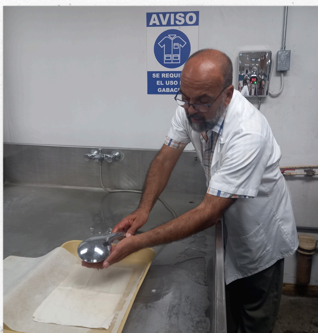
LAVADO ESPECIAL DE DOCUMENTOS