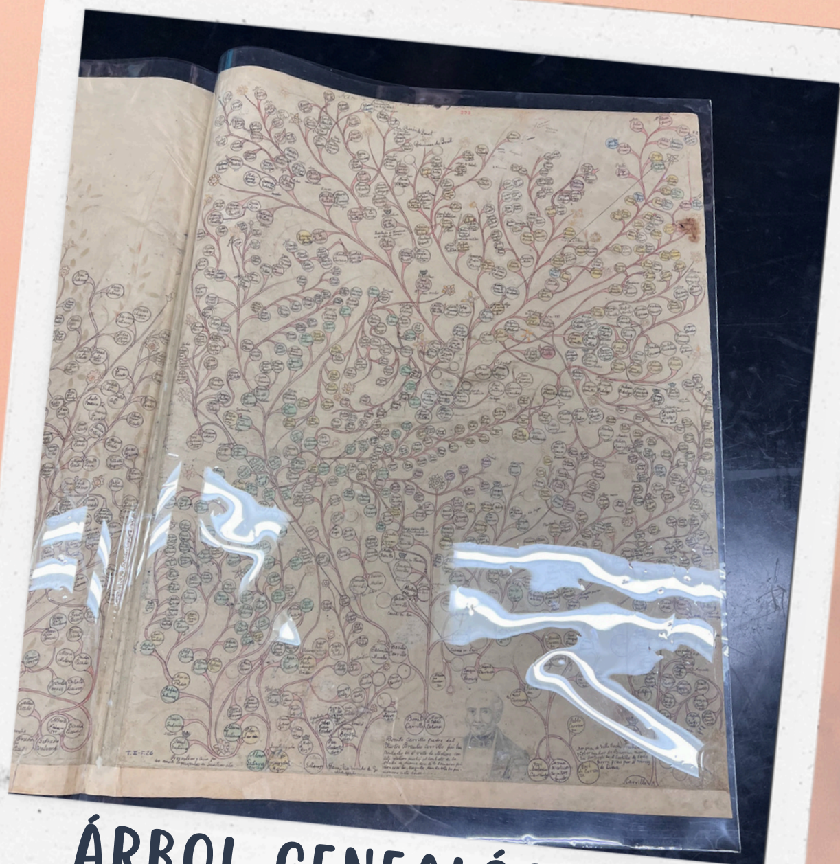
ÁRBOL GENEALÓGICO DE BRAULIO CARRILLO