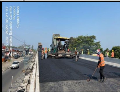
Intercambio Km 62+890