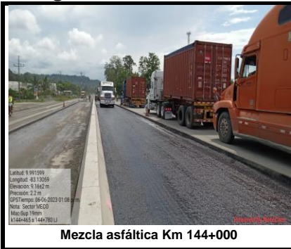
Mezcla asfáltica Km 144+000