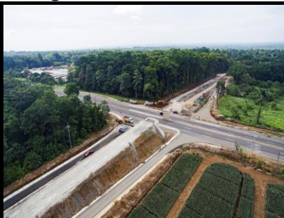
Km 91+000, PSV La Francia

Mediante O.S. No. 19 de CHEC, se traslada la fecha prevista de finalización del proyecto para el día 28 de mayo de 2025 por eventos compensables al Contratista. Sólo se va a realizar en análisis de valor ganado en ésta línea ya que es la rehabilitación y construcción de obra que es una de las etapas más fuertes del proyecto y se está ejecutando en estos momentos.