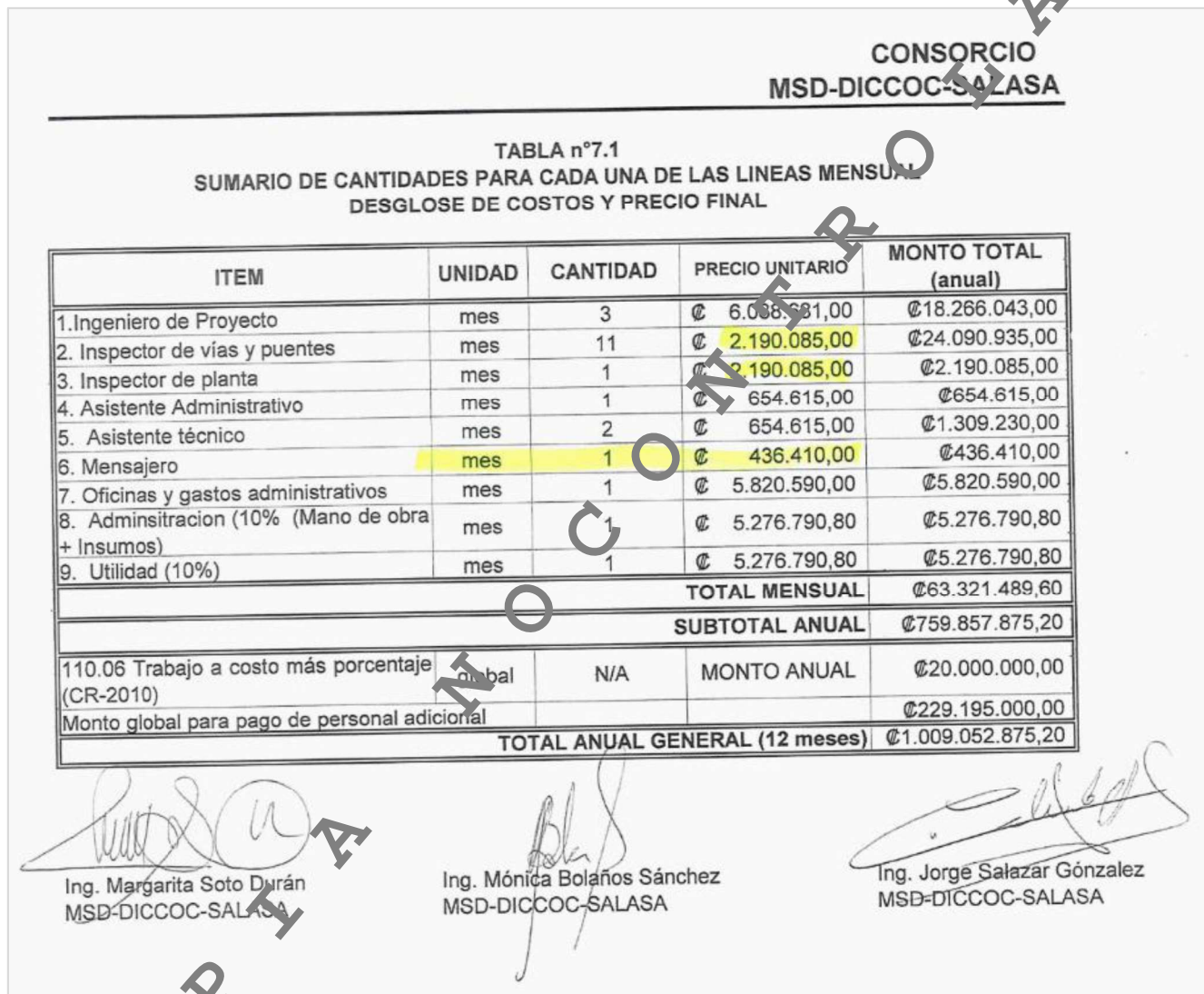
Figura 3. Sumario de cantidades para cada una de las líneas mensual de desglose de costos y precio final del Consorcio MSD-DICCOC-SALASA (Oferta de Servicios del Consorcio).